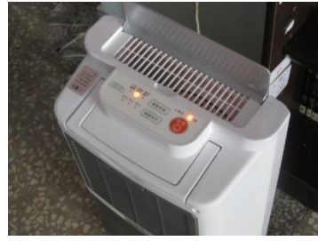
除濕機有效解決潮濕的問題