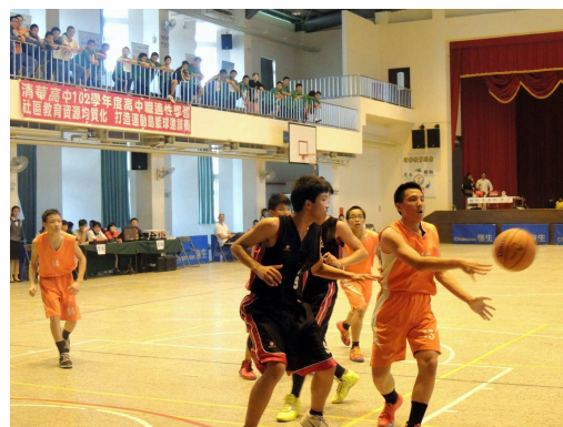
▲清華高中打造運動島，籃球邀請賽精采過程(新屋國中 vs.自強國中)

治平高中連結大學端資源，辦理問卷調查，提供社區內高中職學校調整類科及規劃課程類型之參考，共發出 3,000 份問卷，回收 2,813 份，回收率 93.76%，為桃三區高中職學校就近入學重要參考指標。其他各項活動辦理參與高中職學生數達 1,410、國中學生數達 3,100，超過部定指標；參與國中校數