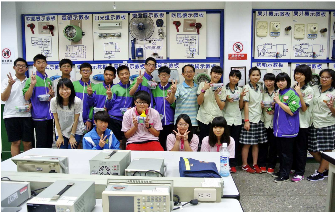
▲楊梅高中辦理職涯探索體驗營—國中生體驗各類科實作。

102 學年度高中職適性學習社區教育資源均質化實施方案，桃三區 4 所公私立高中職合作推動「科技與人文均衡發展」，配合本方案「教育資源共享、適性學習發展、特色教學創新、就近入學推動、教師專業發展」之目標，強化與國中端連結，辦理不同活動與課程，積極經營在地人情，期望在人親土親的桃三區，引導優秀學子就近入學。