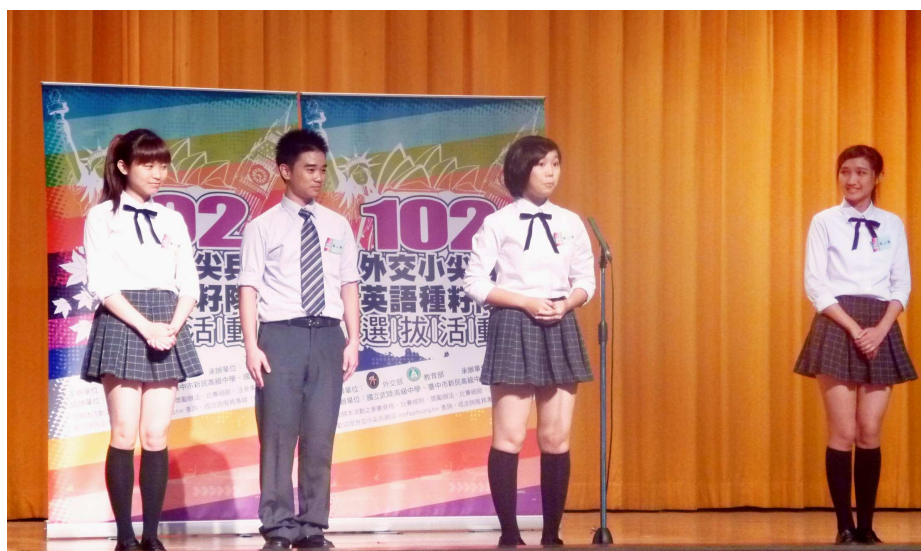
▲北區演說照片。 ▼南區話劇表演。

今年度，究竟哪三隊隊伍能脫穎而出，獲得代表臺灣全國高級中等學校學生，於寒假出國參訪，宣揚臺灣的機會？請讓我們為各區代表加油，且拭目以待。