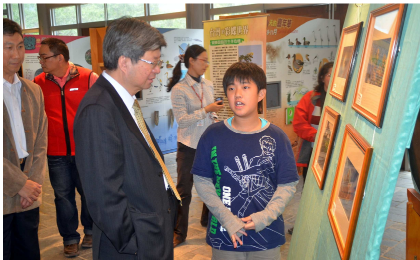
▲草地囡仔攝影展-學生向部長介紹

跆拳道、木工藝術、繪畫社、帆船社等社團，以及正在學校對面無尾港環境學習中心展出的「看見無尾港-庄腳囡子的攝影展」。過程中，吳思華部長鼓勵學童開展多元智能，並結合在地自然人文等特色資源來學習，培養活潑自信的人格以及未來安身立命的能力。