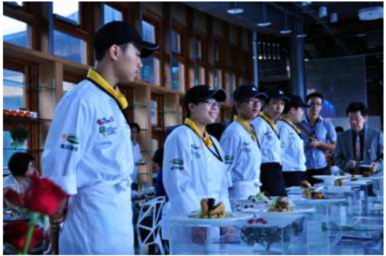
▲「濕情化育漁鄉風情畫」特色課程發展計畫—宜蘭在地食材輕食料理研習暨成果。(圖/蘇澳海事提供)

「資源整合、適性發展、多元選擇」是教育部推動高中職均質化的宗旨，宜蘭地區 6 所高中職校整合資源推動「創活學園」計畫，已有顯著成效，在地國中生就近升學率達 95% 以上，不僅學生有更多學習與休閒的時間，家長更樂見孩子不再長途通勤或至外地住宿求學。