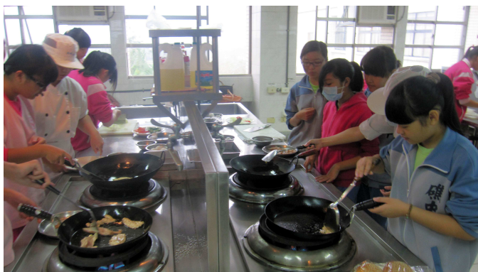
▲職涯探索體驗營—國中生體驗各類科實作。

子計畫各有負責學校，縣立南澳高中執行「教師專業成長計畫」，參與跨校合作課程之教師人數達 484 人次，參加學生數 358 人；教職員研習活動共計 516 人次參與，有效增進合作學校教師間之橫向與縱向聯繫。