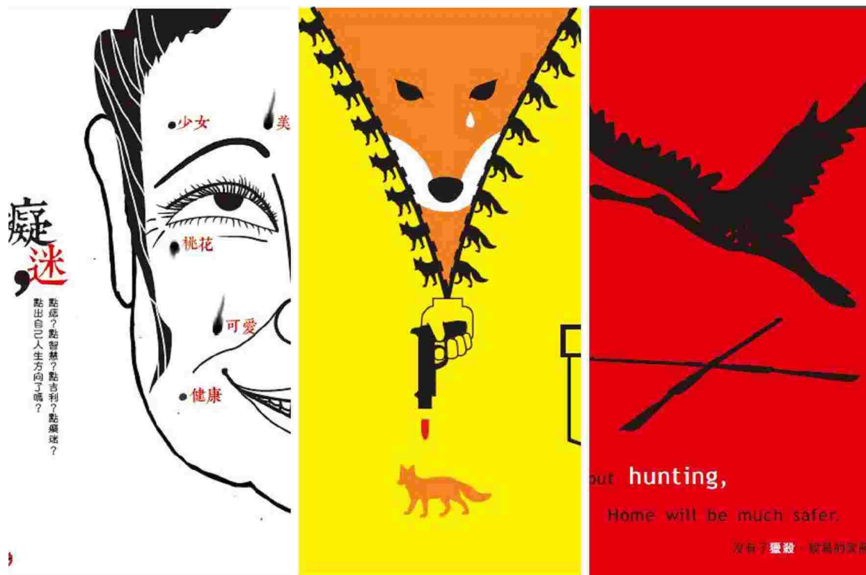
▲設計群科-廣告設計科展出學生作品

長榮高級中學 設計群-廣告設計科 於教育部國教署一樓大廳展出二年級學生的平面設計海報作品展，展期從 1 月 4 日起至 1 月 31 日，歡迎大家蒞臨欣賞。這次展出的平面設計海報展作品是長榮中學廣告設計科學生於二年級專題製作展覽，學生入學前毫無設計基礎，經過一年設計課程洗禮，在短暫的學習過程中能夠有此表現實屬不易。