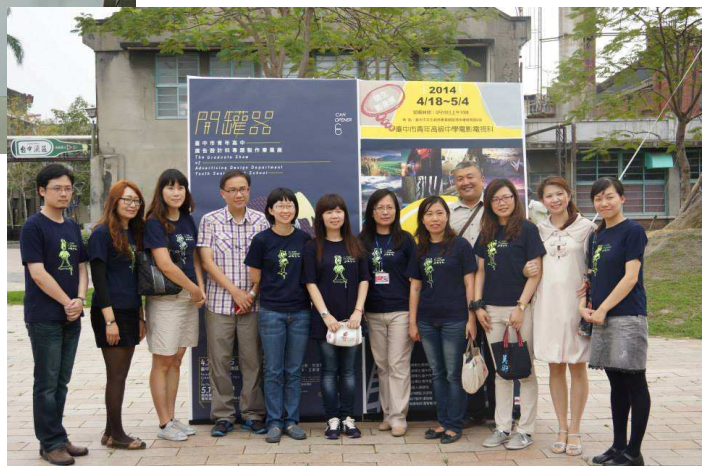
▲廣告設計科及多媒體設計科師資陣容堅強。