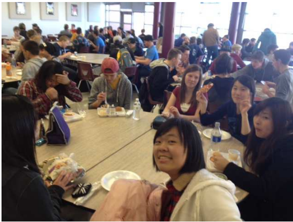
▲基隆女中學生至美國猶他州 Lone Peak 高中文化與教育交流。

為提昇學生國際視野與增進國際能力，基隆女中推行「航向世界專案」。一方面邀請學者專家與學生進行分享與交流，也結合日文課程、法文課程、公民與社會課程及生活藝術課程進行對日本海嘯與核災的關懷、與梵谷大師面對面、國際局勢變遷等教學。另外更帶領學生參訪美國猶他州 Alpine 學區 Lone Peak 高中，安排寄宿家庭、入班學習學伴課程、文化體驗學習活動與服務學習活動。