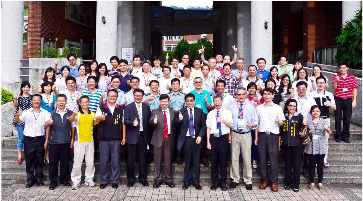
▲蔣偉寧部長與埔里高工全體教職員親切合影。

教育部蔣偉寧部長在國教署王副署長承先及相關同仁陪同下，於 5 月 30 日前往南投縣埔里鎮，參訪國立埔里高級工業職業學校，了解學校辦理高職優質化及推動多元學習之成效，並關懷十二年國教中投區免試入學辦理情形。