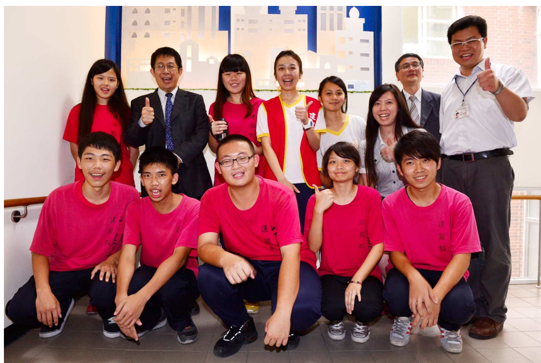
▲蔣偉寧部長與埔里高工建築科師生合影。

校園巡禮結束後，該校校長對蔣部長與一行人等進行簡報與座談，蔣部長於座談會上特別感謝該校籌辦「102 學年度全國教務主任暨校務主任會議」，並關心「十二年國教中投區免試入學」辦理情形。此次的教育關懷之旅，藉由實地訪視與交流活動，除有助於瞭解高中職推動十二年國教的情形，也對突顯多元學習及適性發展具有正向意義。