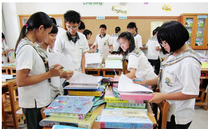
▲臺南市立沙崙國中-學生生涯檔案互評。

規劃。此外，校方不僅定期檢核學生生涯輔導紀錄手冊，更讓學生設計個人化的「生涯檔案」與「技藝學程」學習檔案，一步一腳印真實紀錄學生個人在國中生活中點點滴滴的生涯歷程。