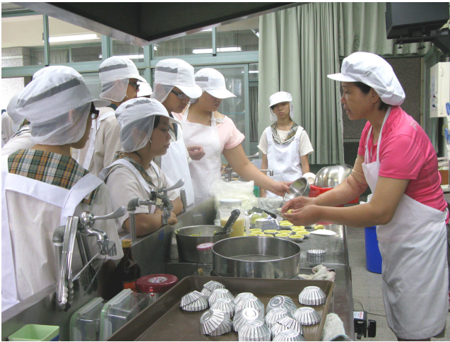
▲臺南市立沙崙國中-技藝課程食品職群上課情形。

距離臺灣海峽僅有 2 公里路程的雲林縣立飛沙國中，為一所偏鄉小校，師生人數約三百人。學校位處濱海地區，人口外流嚴重，各項產業發展不易，學生對於職群的探索與體驗機會並不多，而且社區家長社經地位普遍偏低，學校經費短絀，對於生涯發展教育相關活動的辦理，有著種種的限制與困境。儘管如此，自 91 學年度教育部推動國民中學生涯發展教育起，便積極推展生涯發展教育課程，學校亦有感於教育的重心在於教學，便結