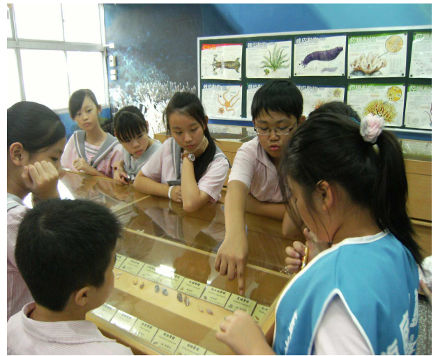
▲小解說員與同學的互動共學