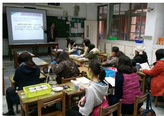
教師共同備課，相互觀摩學習

不論在基本識字、文意理解、推論歸納、省思發表方面，以及現行各項閱讀檢測中，參與計畫學校的學童表現大多優於全區或全市，可見閱讀策略教學及改變評量結構可以提升學童語文能力，也讓學習更有成效。但是，這樣的成果絕非一蹴可及，需要更多教師、家長及有志者一同投入。