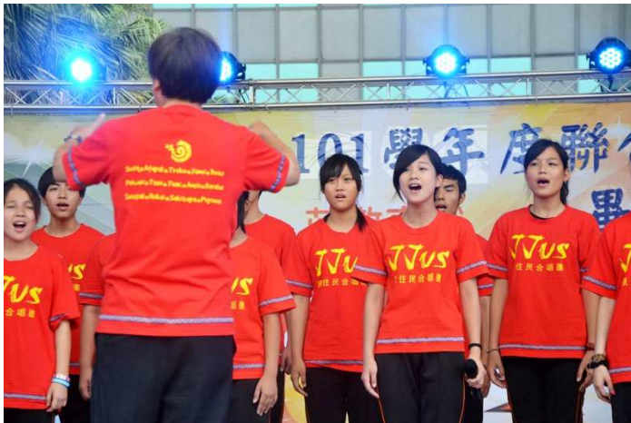
▲學校管樂團銅管五重奏獲得全國音樂比賽優勝

配合保障原住民政策並發揮社會公義精神，學校重視關懷弱勢學生議題，不論從教育機會均等、人道關懷、精緻教育、社會安全的觀點，匯集群體的力量拉扶弱勢學生。學校並與玄奘大學合作，提供原住民畢業生四年大學學雜費全免升學管道，讓學生可順利的接軌到高等教育，找到人生發展的方向，產生最大教育價值。